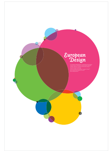
Mapping Europe – 1

Τελικά, η αφίσα, εκ πρώτης όψεως, ίσως αδυνατεί να αναφερθεί στο σύνολο των περιστάσεων και των προσώπων που ενδεχομένως εμπλέκονται σε μια περίπτωση σεξουαλικής βίας (π.χ. ενδοοικογενειακή βία, σεξουαλική κακοποίηση ανηλίκων κ.τ.λ.) εστιάζοντας κυρίως στην σεξουαλική βία κατά των γυναικών. Παρόλα αυτά, η εικόνα της σταυρωμένης γυναίκας μπορεί να λειτουργήσει καθαρά συμβολικά (όπως άλλωστε και συμβαίνει όταν χρησιμοποιείται η έννοια της σταύρωσης - λέμε «ο καθένας κουβαλάει τον δικό του σταυρό...»). Με αυτόν τον τρόπο, το πρόβλημα αντιμετωπίζεται ολιστικά καταρρίπτοντας την ανάγκη για επιμέρους προσεγγίσεις.